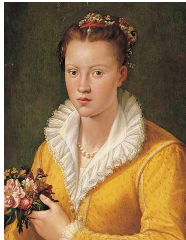
Girolamo Macchietti, Portrait de femme , Collection privée, New York

Cette toile de Vasari, artiste et écrivain, marque l'avènement des Médicis. Alexandre de Médicis se tourne en conquérant vers la ville de Florence, représentée à l'arrière-plan. Ce tableau reprend également les codes du portrait de Cour : le plan est plus large, le décor, le mobilier et la tenue sont plus fastueux qu'au début du siècle.