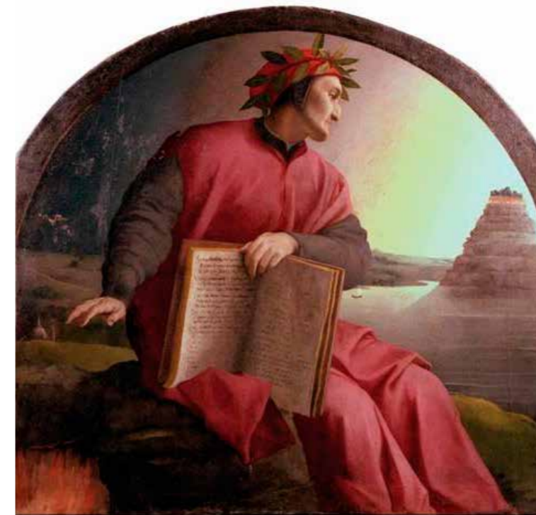
Agnolo Bronzino, Dante , Collection privée, Florence.

Ce portrait de jeune femme parée de bijoux et élégamment vêtue, met en exergue son rang et fait référence aux fastes de la cour. Dans le même esprit, la bourgeoisie florentine de l'époque aime afficher sa culture. Le portrait de la jeune fille lisant Pétrarque en deuxième page, d'Andrea del Sarto en est l'exemple même.