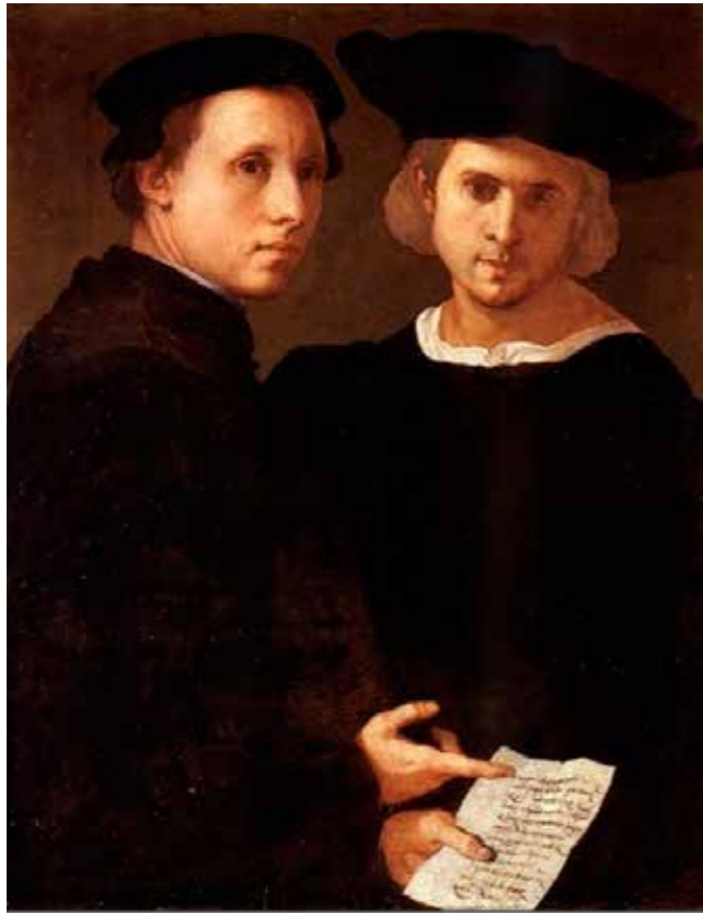
Pontormo, Portrait de deux amis , 1522, Fondation Cini, Venise

Non sans rappeler le Double Portrait de Raphaël (1516), l'intensité de la pose de ces deux hommes, à la fois austère et sobre, est propre aux portraits florentins de la période Républicaine du début du siècle. Ils pointent la lettre d'un ami, geste hautement symbolique du lien d'amitié qui lie ces deux hommes à Pontormo. Cette lettre fait alors exister l'ami absent.