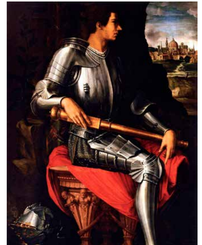
Giorgio Vasari, Portrait d'Alexandre de Médicis , 1534, Galerie des Offices, Florence.

Non sans rappeler le Double Portrait de Raphaël (1516), l'intensité de la pose de ces deux hommes, à la fois austère et sobre, est propre aux portraits florentins de la période Républicaine du début du siècle. Ils pointent la lettre d'un ami, geste hautement symbolique du lien d'amitié qui lie ces deux hommes à Pontormo. Cette lettre fait alors exister l'ami absent.