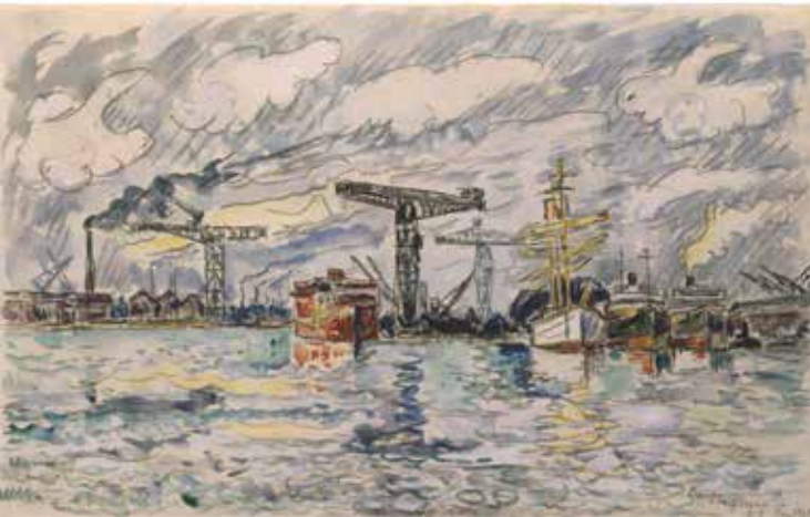
Paul Signac Saint-Nazaire 23 juillet 1929 Aquarelle et mine de plomb sur papier vergé 27,5 x 44 cm Collection particulière