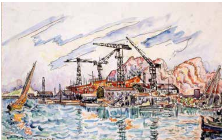
Paul Signac La Ciotat Vers 1930 Aquarelle et mine de plomb sur papier vergé 27,7 x 44 cm Collection particulière