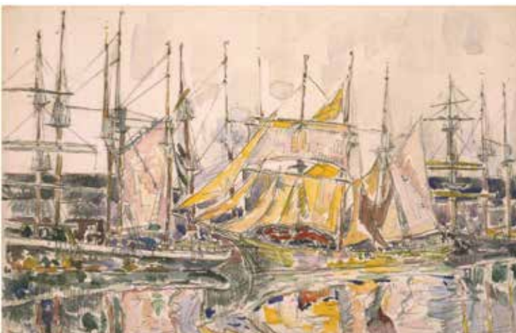
Paul Signac Saint-Malo. Les voiles jaunes 29 octobre 1929 Aquarelle et mine de plomb sur papier vergé 29 x 44 cm Collection particulière