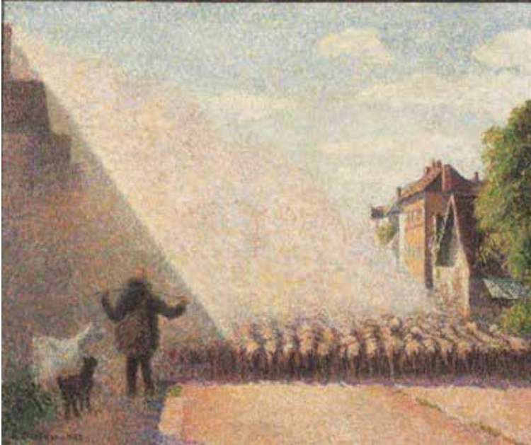
Camille Pissarro (1830 – 1903) Le Troupeau de moutons à Éragny 1888 Huile sur toile 46,2 x 55,2 cm Collection particulière