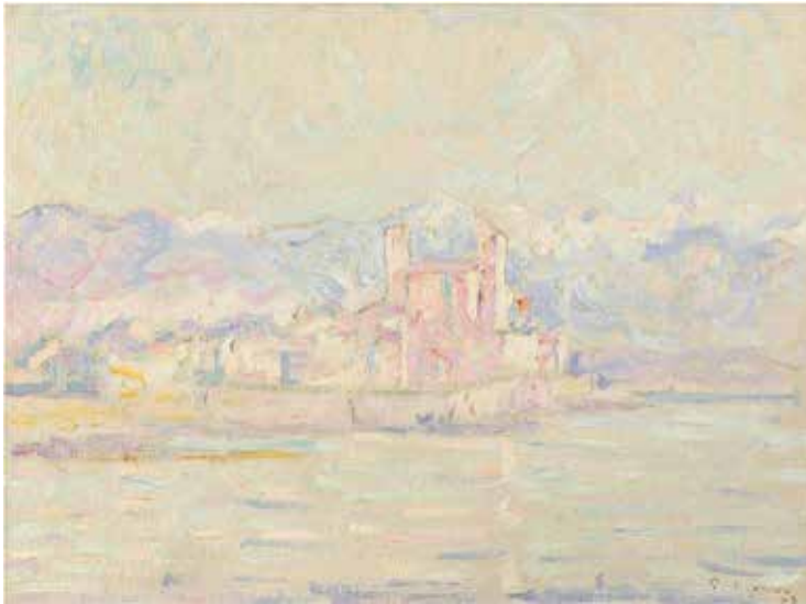
Paul Signac Antibes. Matin 1903 Huile sur carton-toile 26,6 x 35,5 cm Collection particulière

Pour réaliser le jeu en page 8 du livret, observe les oeuvres ci-dessous