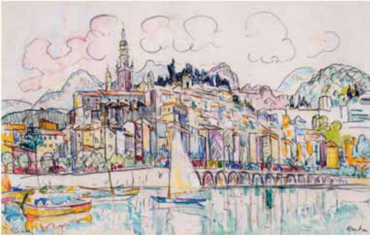
Paul Signac Menton 1931 Aquarelle et mine de plomb sur papier vergé 27,2 x 43,2 cm Collection particulière