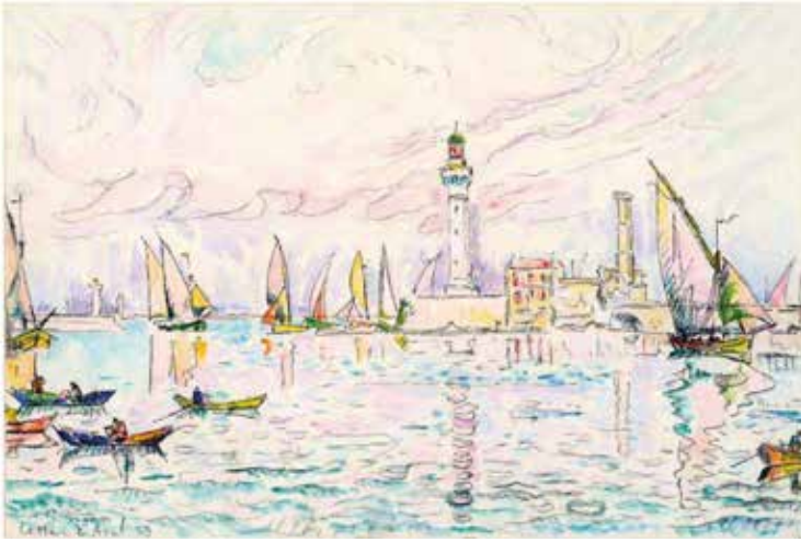
Paul Signac Sète 2 avril 1929 Aquarelle et mine de plomb sur papier vergé 28,6 x 43,5 cm Collection particulière