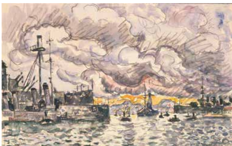
Paul Signac La Rade de Toulon ou Toulon. Ciel d'orage Avril 1931 Aquarelle et mine de plomb sur papier vergé 27,3 x 43,8 cm Collection particulière