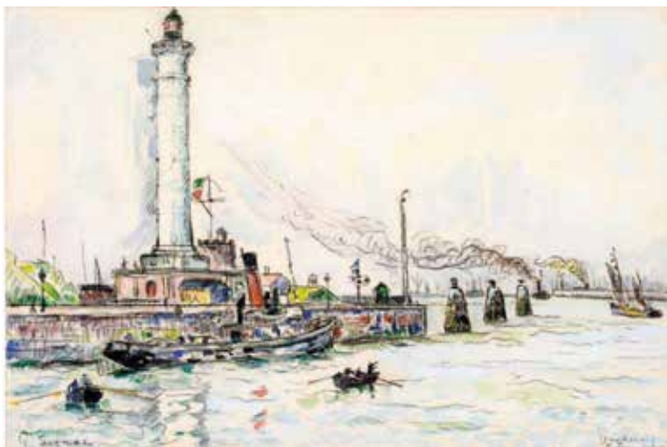
Paul Signac Dunkerque 5 juin 1930 Aquarelle et mine de plomb sur papier vergé 29,2 x 44 cm Collection particulière