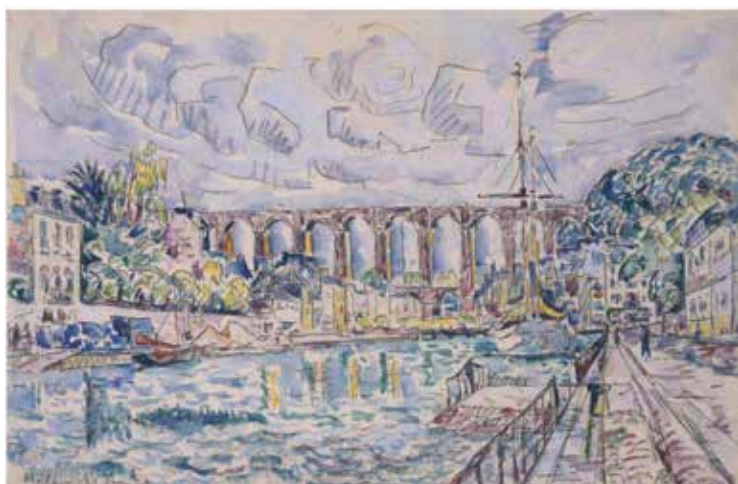
Paul Signac Morlaix 21 juin 1929 Aquarelle et mine de plomb sur papier vergé 29 x 44,2 cm Collection particulière