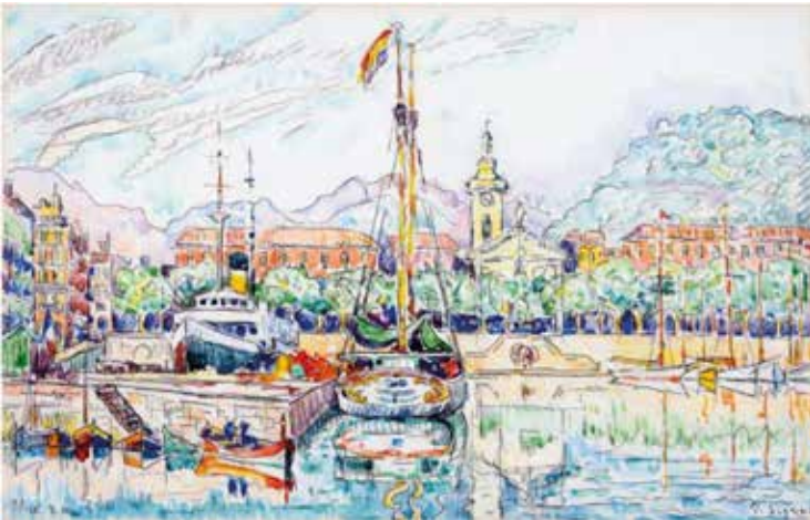
Paul Signac Nice 2 mai 1931 Aquarelle et mine de plomb sur papier vergé 27,3 x 43,2 cm Collection particulière