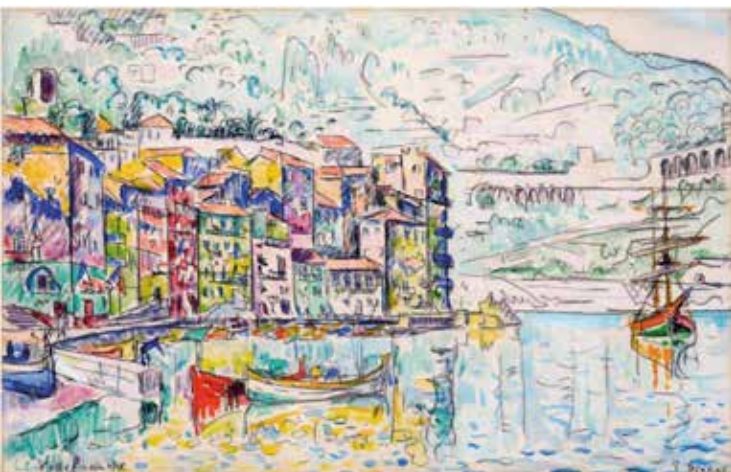
Paul Signac Villefranche-sur-Mer 1931 Aquarelle et mine de plomb sur papier vergé 28 x 43,6 cm Collection particulière