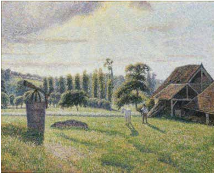
Camille Pissarro (1830 – 1903) La Briqueterie Delafolie à Éragny 1886-1888 Huile sur toile 55 x 72 cm Collection particulière

Pour réaliser le jeu en page 5 du livret, observe les oeuvres ci-dessous