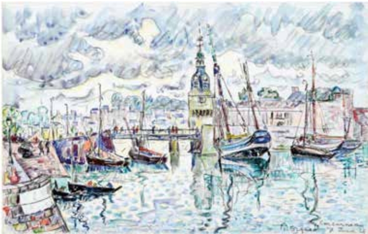
Paul Signac Concarneau 7 juin 1929 Aquarelle et mine de plomb sur papier vergé 27,2 x 43,2 cm Collection particulière

Pour réaliser le jeu en page 7 du livret, observe les oeuvres ci-dessous