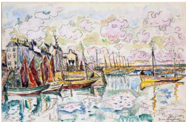
Paul Signac Douarnenez 13 juin 1929 Aquarelle et mine de plomb sur papier vergé 29 x 44 cm Collection particulière