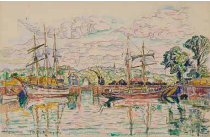
Paul Signac Paimpol 13 août 1929 Aquarelle et mine de plomb sur papier vergé 28,7 x 44,2 cm Collection particulière