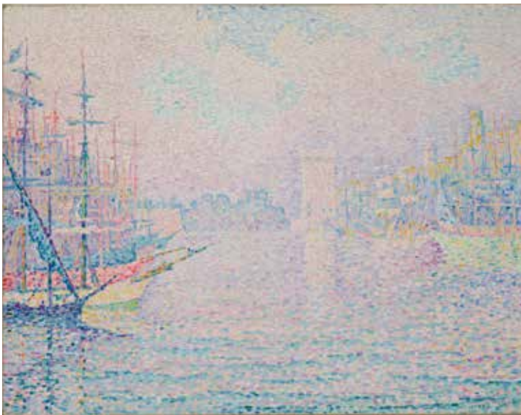
Paul Signac Marseille. Le Vieux-Port 1906 Huile sur toile 73 x 92 cm Collection particulière