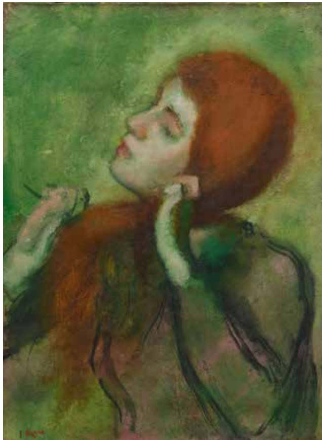
Edgar Degas (1834 – 1917) Femme se coiffant 1894, huile sur toile