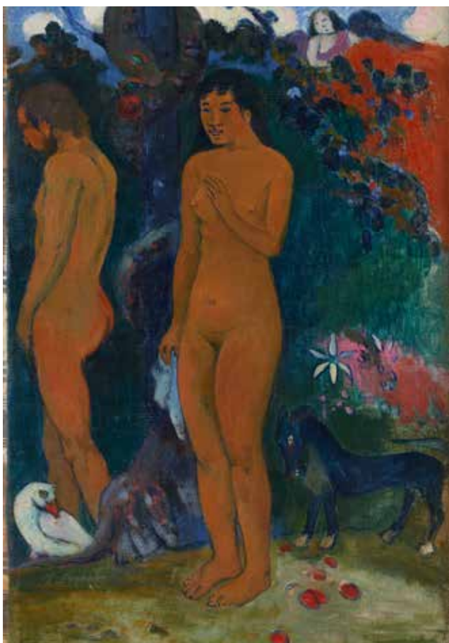
Paul Gauguin (1848 – 1903) Adam et Ève 1902, huile sur futaine