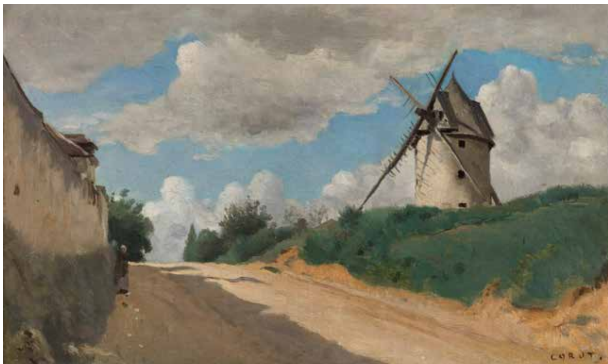
Camille Corot (1796 – 1875) Le Moulin à vent Vers 1835-1840, huile sur toile