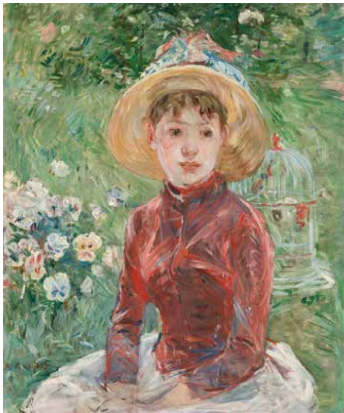
Berthe Morisot (1841 – 1895) « Jeune Fille sur l'herbe ». Le Corsage rouge (Mademoiselle Isabelle Lambert) 1885, huile sur toile