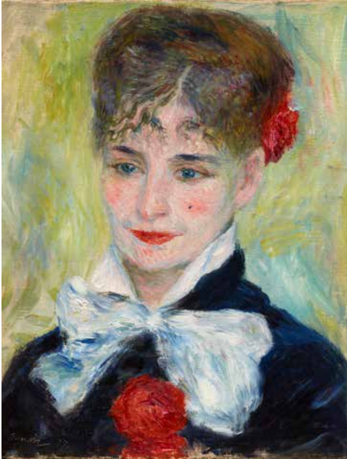
Pierre-Auguste Renoir (1841 – 1919) Portrait d'une Roumaine (Madame Iscovesco) 1877, huile sur toile