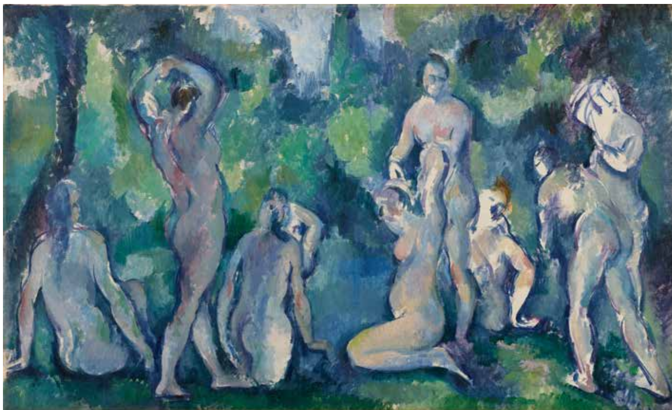
Paul Cézanne (1839 – 1906) Baigneuses Vers 1895, huile sur toile