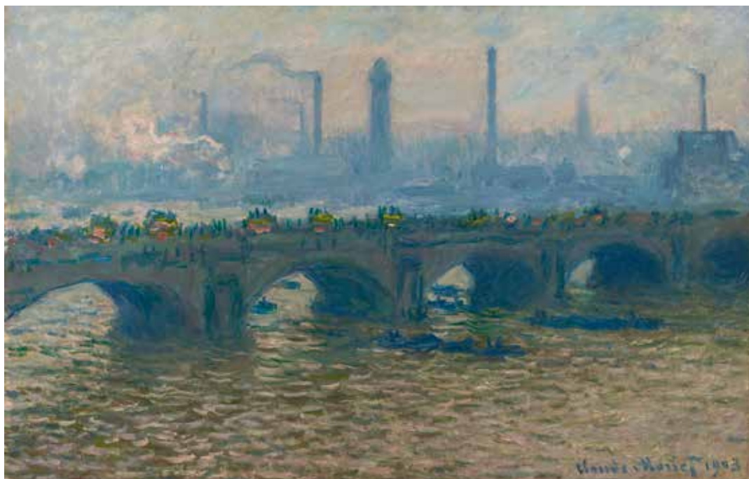
Claude Monet (1840 – 1926) Le Pont de Waterloo, temps gris 1903, huile sur toile