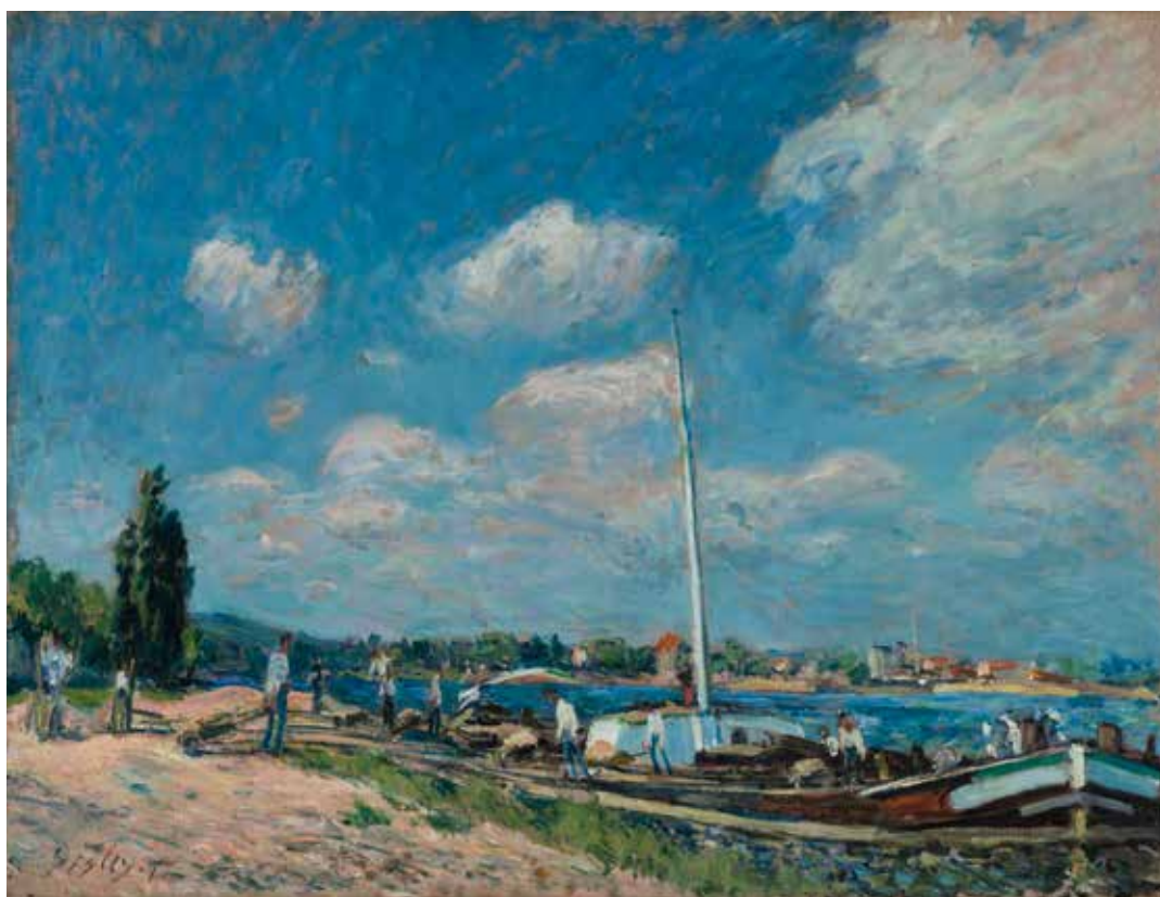
Alfred Sisley (1839 – 1899) Le Déchargement des péniches à Billancourt 1877, huile sur toile